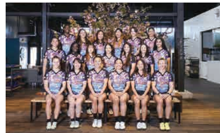
ながとブルーエンジェルス